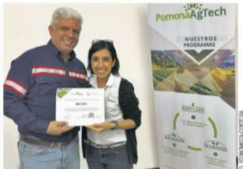
El plan de seguimiento los logros alcanzados y evalúa el impacto del proyecto.